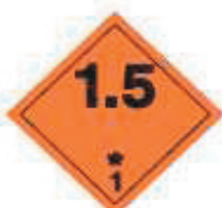
(No.1.5) División 1.5