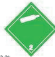
(No.2.2) División 2.2 Gases no inflamables, no tóxicos Símbolo (bombona): negro o blanco; Fondo: verde; cifra "2" en el ángulo inferior