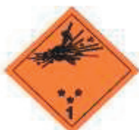
(No.1) Divisiones 1.1, 1.2 y 1.3

Símbolo (bomba explotando): negro; Fondo: anaranjado; cifra "1" en el ángulo inferior