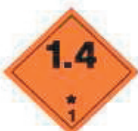
(No.1.4) División 1.4

Símbolo (bomba explotando): negro; Fondo: anaranjado; cifra "1" en el ángulo inferior