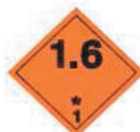
(No.1.6) División 1.6