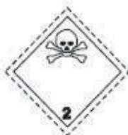
(No.2.3) División 2.3 Gases tóxicos Símbolo (calavera y tibias cruzadas): negro; Fondo: blanco; cifra "2" en el ángulo inferior