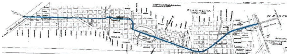
Figura 3: Recorrido del Arroyo Medrano dentro de la CABA

El emisario presenta una pendiente de fondo prácticamente constante del orden del 2 por mil hasta aproximadamente la avenida Cabildo donde comienza a descender a valores próximos al 1 por mil, mientras que la pendiente media de los conductos secundarios es del orden del 4 por mil, en su cabecera, descendiendo a valores del 1 por mil en su descarga en el entubamiento del Medrano.