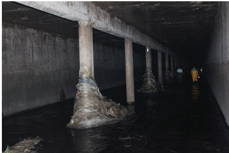
Figura 2: Residuos sólidos acumulados en columnas dentro del Emisario Principal

Entre las causas que agravan los efectos de las lluvias intensas se encuentran las obstrucciones en las redes de desagües por la acumulación de basura y la obstrucción de sumideros con residuos sólidos urbanos arrastrados en las calles.